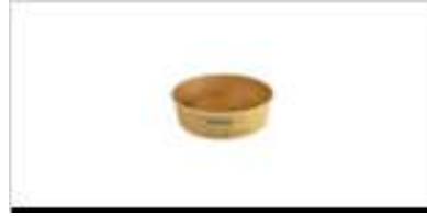
Photo du Produit :

Ref. article : 196010 Désignation : Boîte ronde Ronda Large 500ml 150x150x45mm Carton/PLA Marron ----- Condt carton : 5x50 ----- Marché : Professional (MS) Gamme : Meal Service Collection : Year-round Produit personnalisé : N (N : No ; Y : Yes)