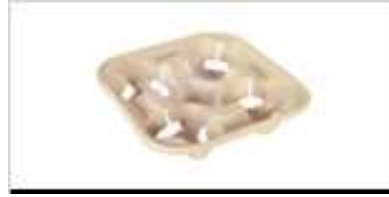
Photo du Produit :

Produit personnalisé : N (N : No ; Y : Yes)