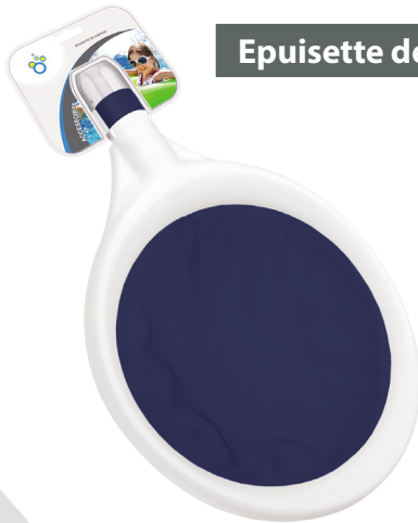
Epuisette de surface