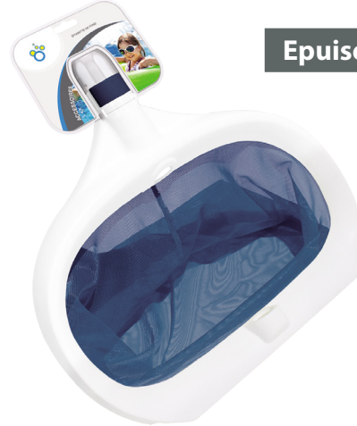
Epuisette de fond