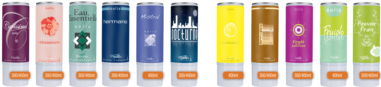
Les créations nobles / Fine creations

🍷 Parfum de haute qualité 🍷 Fabriqué en France 🍷 Recharge exclusive 🍷 tête en bas 🍷 disponible en 300ml et 400ml. 🍷 High quality fragrances 🍷 Made in France 🍷 Exclusive refills 🍷 Available in 300ml and 400ml.