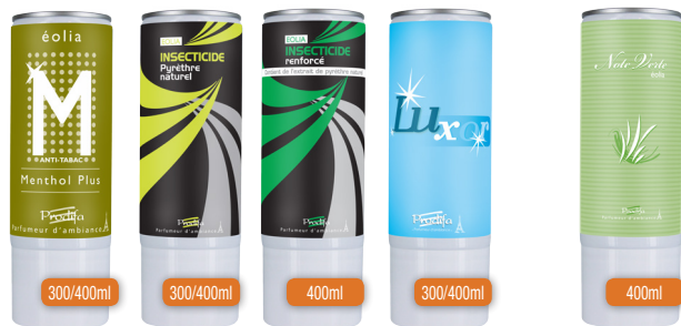
Traitement / Treatment